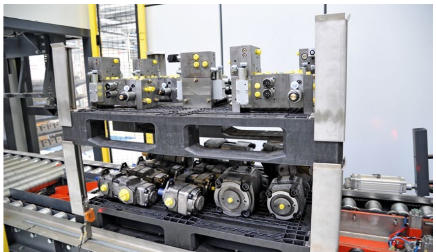
Zwei Kunststoffpaletten mit unterschiedlichen Hydraulikaggregaten auf dem Weg in die Behandlungskammer

Die Teile gelangen auf Kunststoffpaletten in die Durchlaufanlage und verlassen die Anlage lackierfertig auf der Saubenseite rechts im Bild.