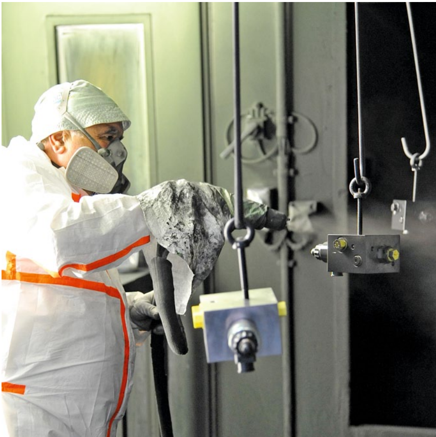
Die Hydraulikaggregate werden direkt nach der Reinigung manuell mit 2K-Nasslack beschichtet

spektrum in die Behandlungskammer gelangt.