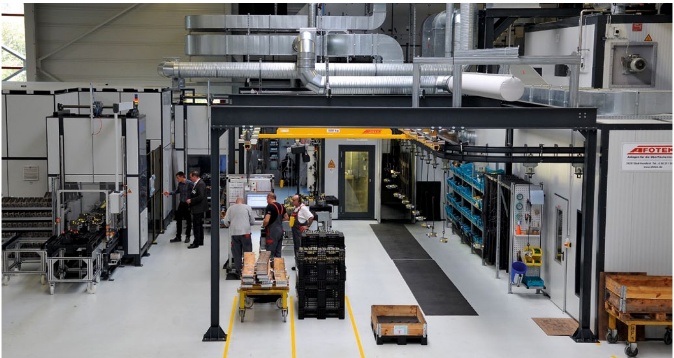
Das Gesamtkonzept wurde speziell für Bucher Hydraulics, Hersteller von Hydraulikaggregaten, ausgelegt und verbindet die Teilereinigungsanlage (links) platzsparend mit der Lackieranlage

Die Reinigung der Teile entpuppte sich als Knackpunkt innerhalb des Anlagenkonzeptes. Und zwar nicht nur aufgrund des vorgegebenen, geringen Restschmutzgehaltes, sondern auch wegen einer weiteren Besonderheit bei